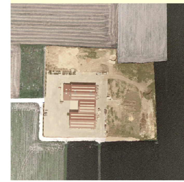
Insedimenti puntuali sparsi in ambito agricolo