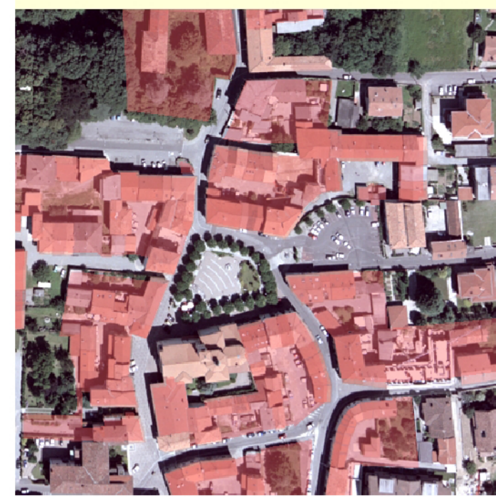
Nuclei di carattere storico