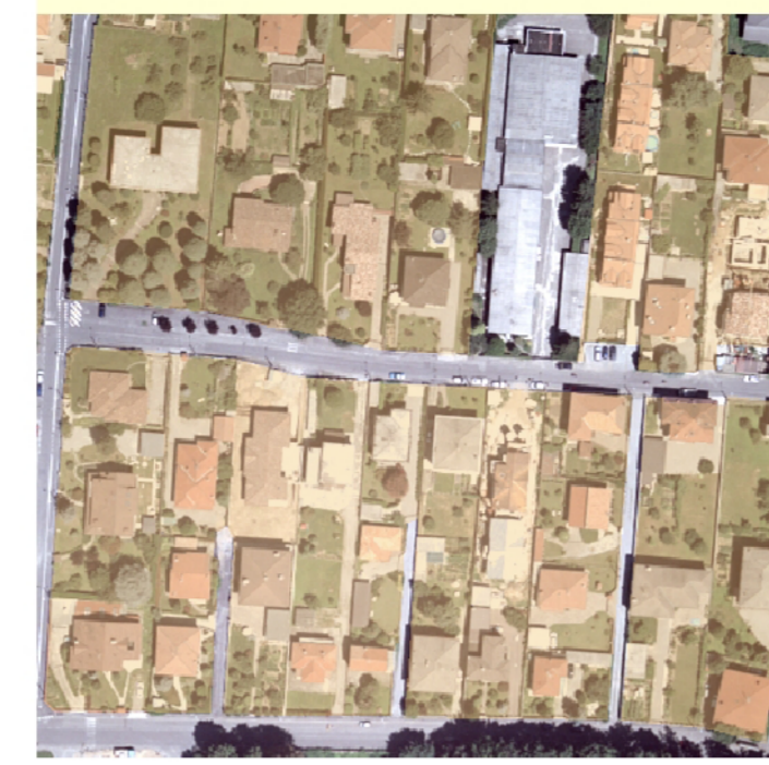
Fabbricazione isolata rada chiusa