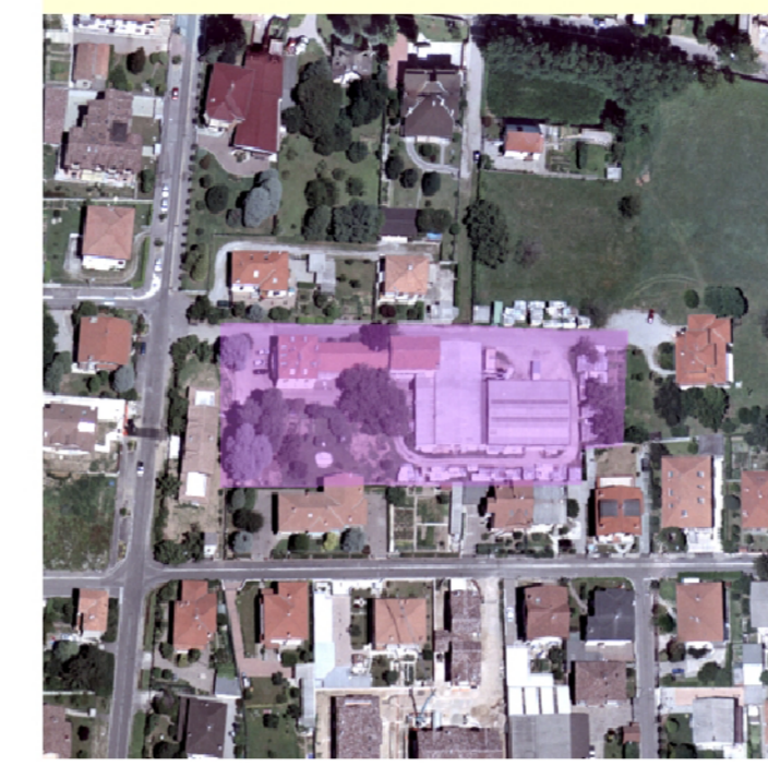
Elementi puntuali produttivi