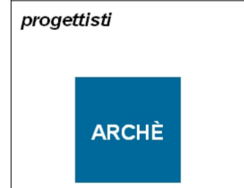
tavola n. QC 02/06 scala 1 : 5.000

progettisti arch. Franco Resnati arch. Fabio Massimo Saldini